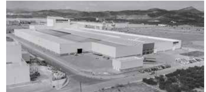
ESPAÑA - Moncofar