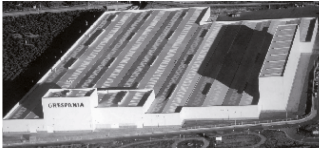
ESPAÑA - Nules

INNOVACIÓN - DISEÑO - CALIDAD - SERVICIO